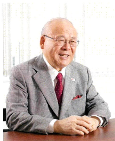
武部 勤様 元自由民主党幹事長 元農林水産大臣 公益財団法人東亜総研 代表理事・会長

※今回の講演内容に関するご質問等ございましたら、下記メールアドレスまたはFAX宛にご連絡くださいますようお願いいたします。